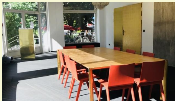
(1) Separater heller Seminarraum im Erdgeschoss.

Anreise und Unterkunftsmöglichkeiten entnehmen Sie bitte der Internetseite des Hotels www.riverside-mitte.de