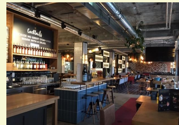
(2) Mittagessen mit offener italienischer Küche.