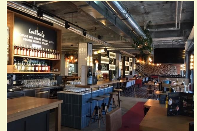
(2) Mittagessen mit offener italienischer Küche.