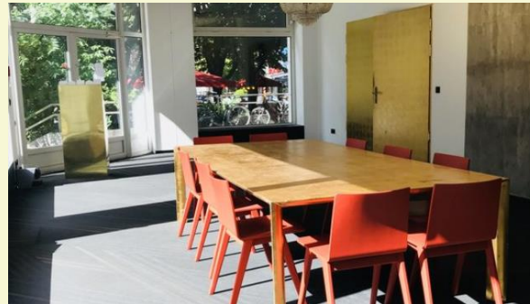
(1) Separater heller Seminarraum im Erdgeschoss.

Anreise und Unterkunftsmöglichkeiten entnehmen Sie bitte der Internetseite des Hotels www.riverside-mitte.de